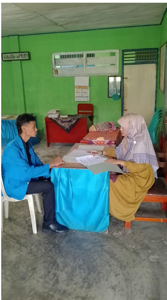
Wawancara Kepada Guru PAI SMA Kosgoro Sekampung