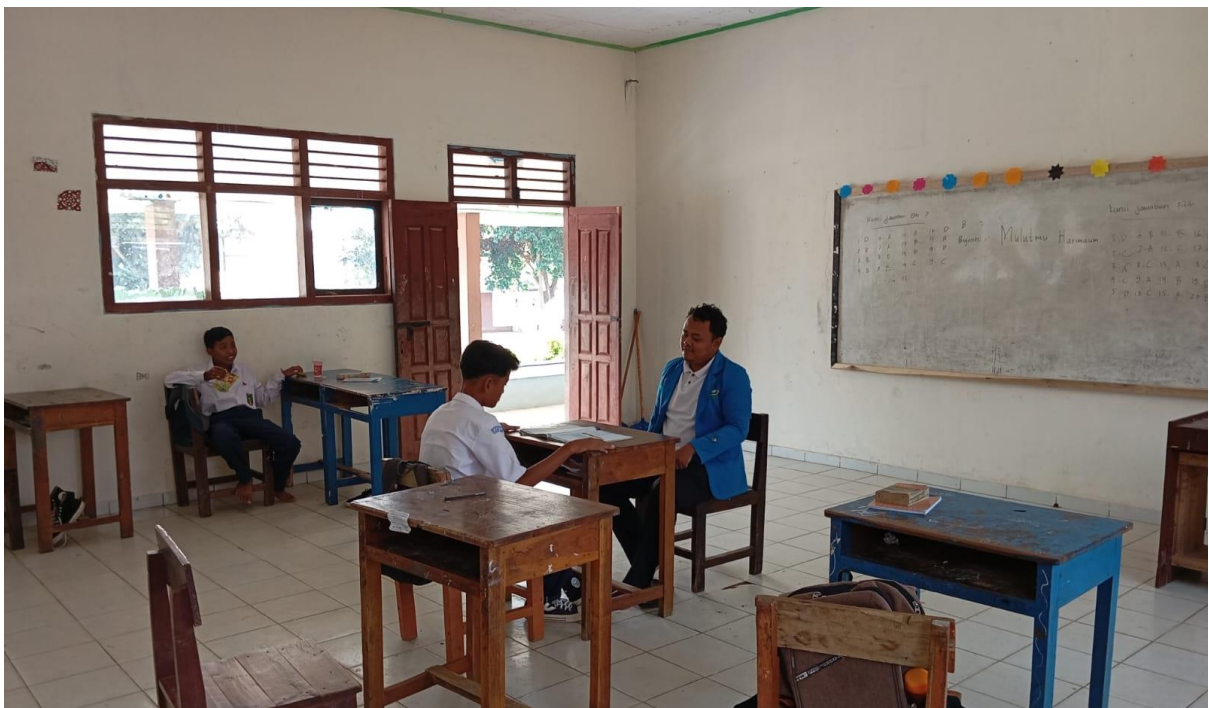
Gambar 04: Dialog dengan siswa terkait kendala Pengucapan Huruf Hijaiyah pada Keterampilan Membaca Teks Arab Siswa Kelas VII SMP Islam Muhammadiyah Margototo