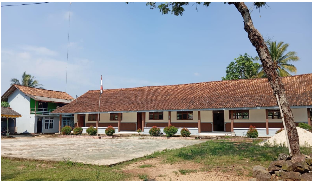
Gambar 01: Lokasi penelitian SMP Islam Muhammadiyah Margototo