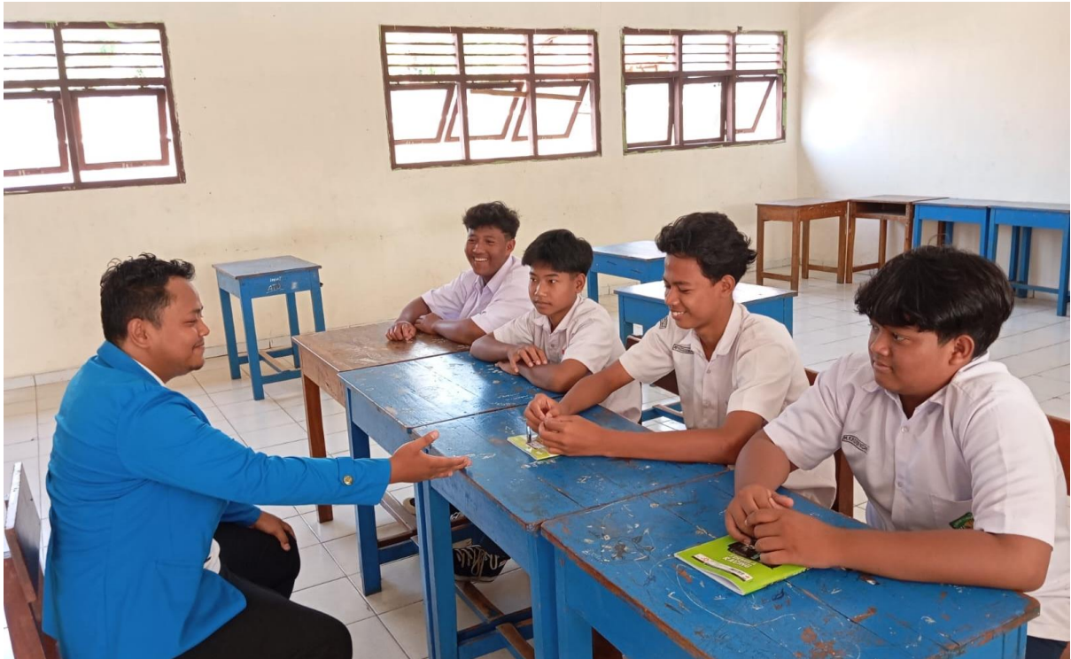
Gambar 03: Dialog dengan siswa terkait Kesalahan Pengucapan Huruf Hijaiyah pada Keterampilan Membaca Teks Arab Siswa Kelas VII SMP Islam Muhammadiyah Margototo