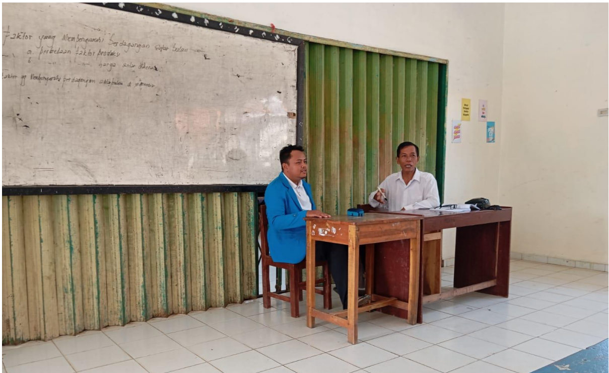
Gambar 06: Observasi Guru Mengajar Huruf Hijaiyah pada Keterampilan Membaca Teks Arab Siswa Kelas VII SMP Islam Muhammadiyah Margototo