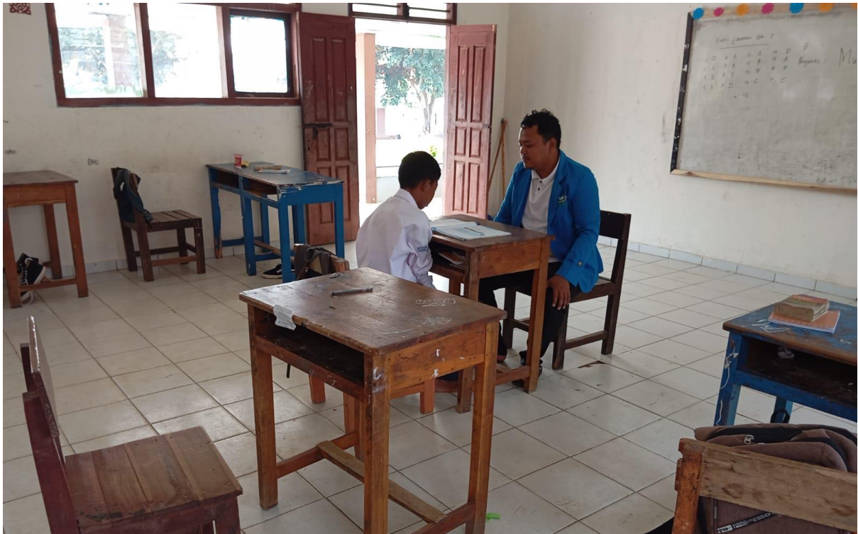
Gambar 05: Dialog dengan siswa terkait perkembangan Pengucapan Huruf Hijaiyah pada Keterampilan Membaca Teks Arab Siswa Kelas VII SMP Islam Muhammadiyah Margototo