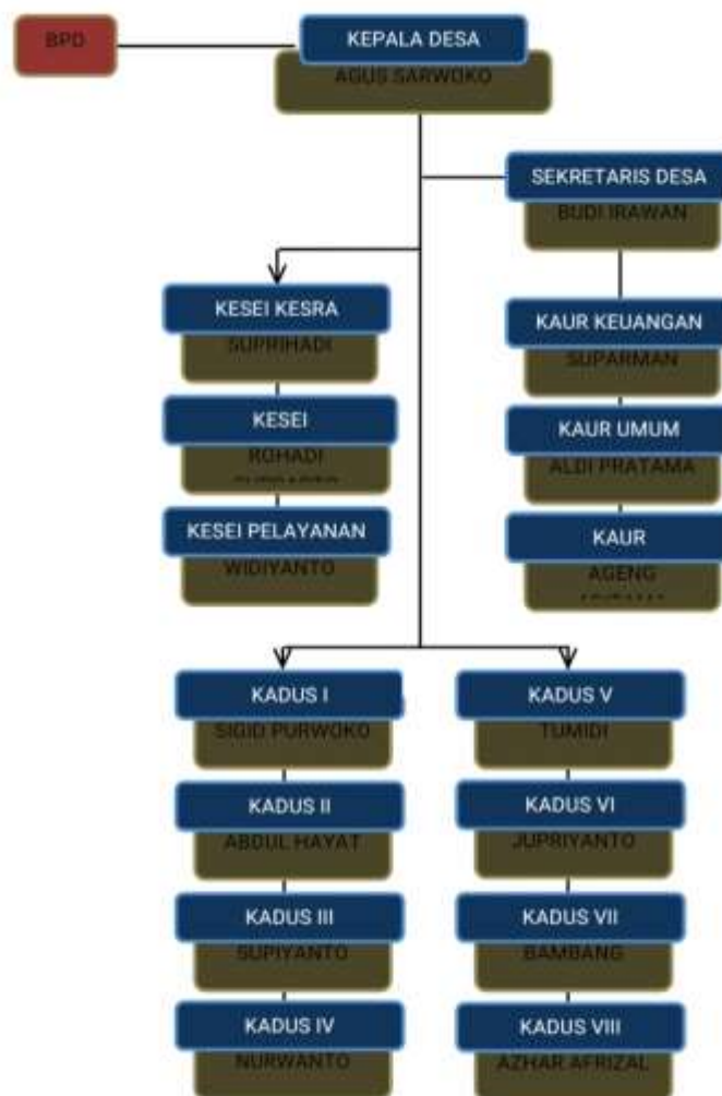
Gambar 4.1 Struktur Organisasi Pemerintahan Desa Sidodadi

Struktur Organisasi Pemerintahan Desa Sidodadi Kec. Pekalongan Kab. Lampung Timur