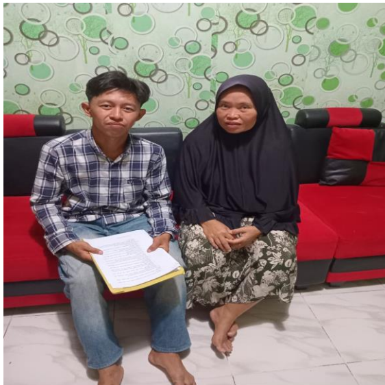
Wawancara dengan Ibu Erna selaku pengunjung Wisata Petk Jeruk