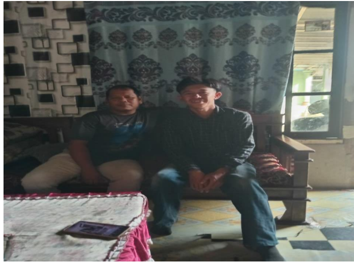
Wawancara dengan Bapak Toing selaku pemilik Wisata Petik Jeruk