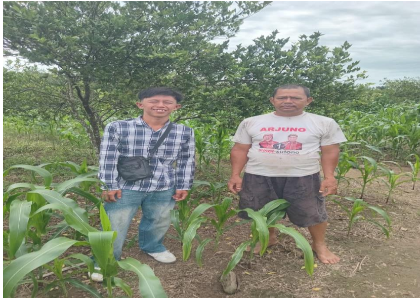
Wawancara dengan bapak uwan selaku pemilik wisata petik jeruk