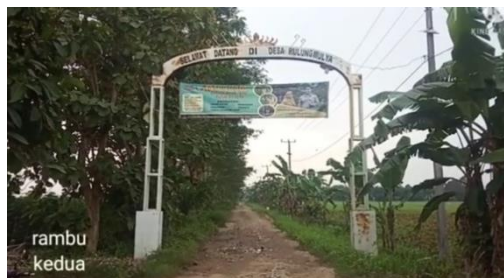
Gambar 4.1 Gapura Wisata Petik Jeruk

Desa Batanghari Ogan terbagi menjadi 4 Dusun dan 14 RT ke 4 dusun tersebut adalah Dusun 1 Batanghari, Dusun II Talang Tengah, Dusun III Raja Bungsu Dan Dusun VI Lubai , dengan berbatasan: