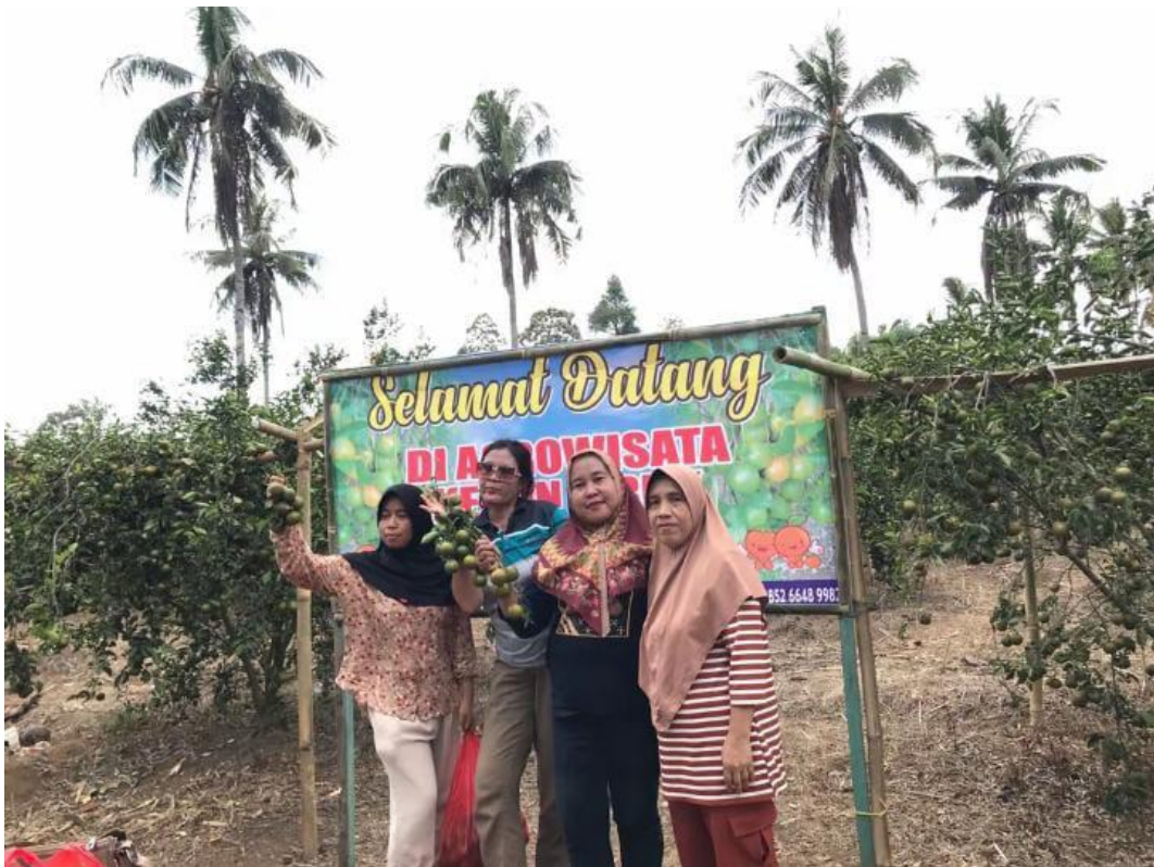
Pintu Masuk Wisata Petik Jeruk