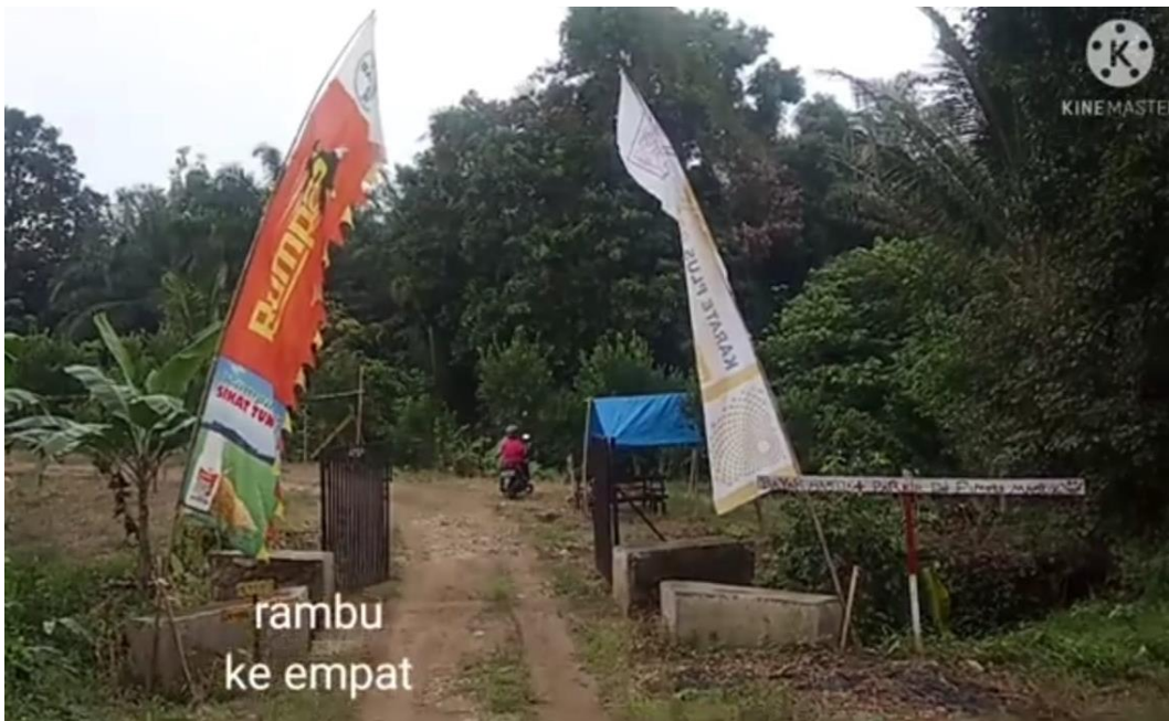
rambu ke empat