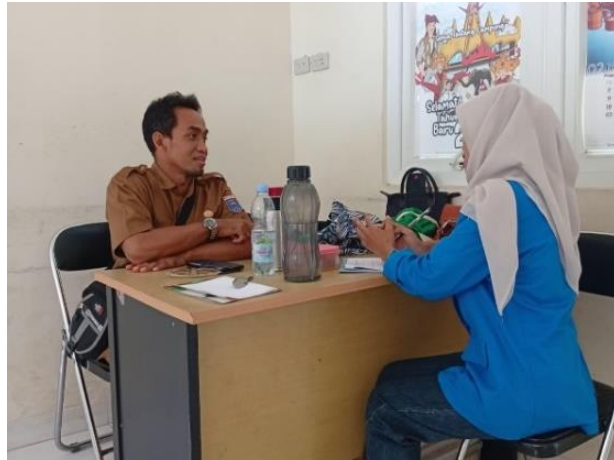
Wawancara dengan Bapak Sis Guru di Pusat Layanan Autis Kota Metro