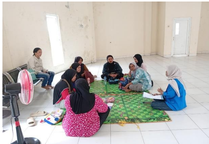
Wawancara Kepada Wali Murid Anak Autis di Pusat Layanan Autis Kota Metro