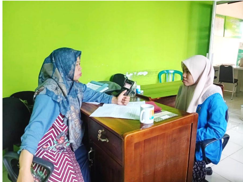
FOTO BERSAMA PENYULUH KUA BATANGHARI