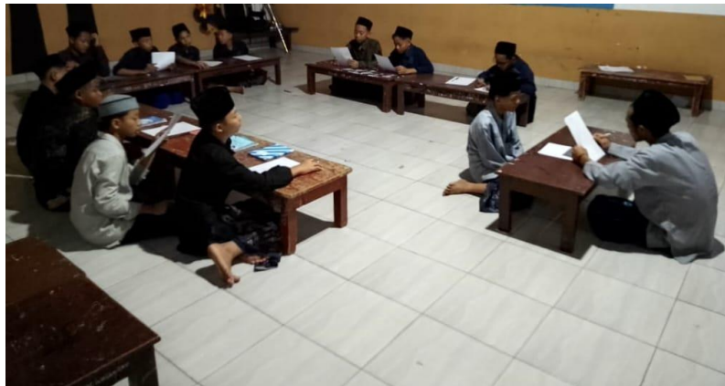
Gambar 2. Penerapan Tes Lisan Menggunakan Metode Sorogan