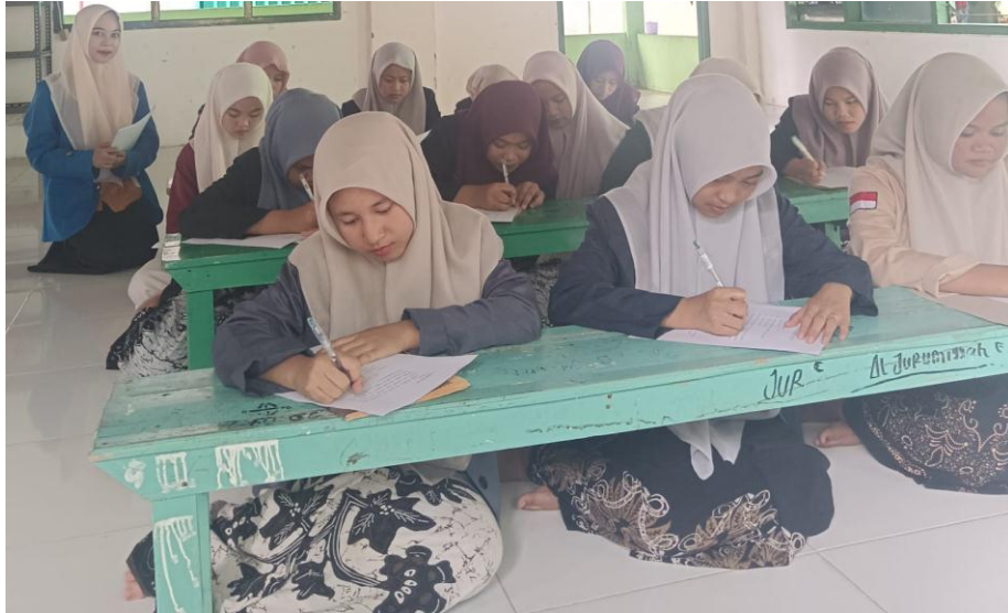
Gambar 1. Pengisian angket oleh santri di Pondok Pesantren Nuurussholihin Metro Pusat