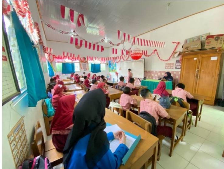
Observasinya Saat pembelajaran IPAS berlangsung