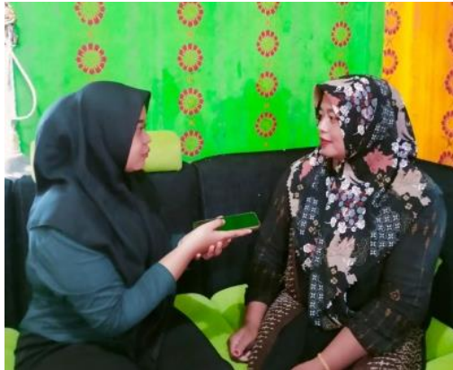
Wawancara Ibu Apri