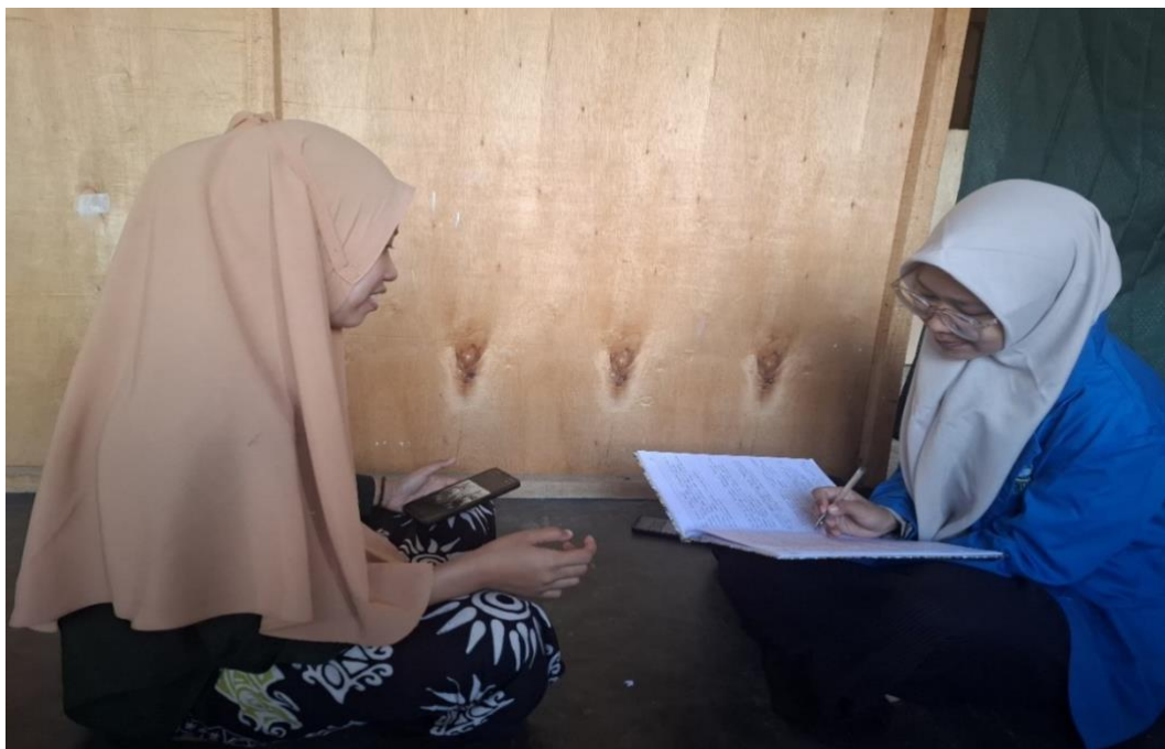
Wawancarana peserta putri dan kegiatan bahtsul masail