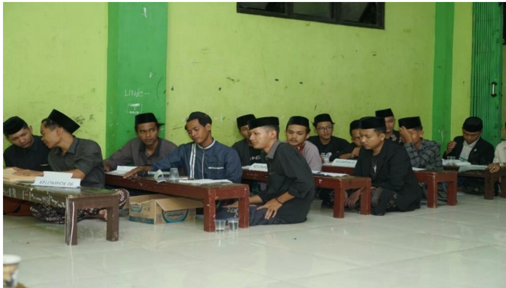
Dokumentasi kegiatan Bahtsul Masail pada malam hari

Keterangan foto proses pembelajaran penerapana metode bahtsul masail dalam pengembangan pemahaman fiqh muamalah bagi santri pondok pesantren riyadlatul ulum 39B batanghari lampung timur