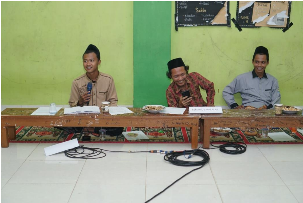
Foto wawancara dan dokumentasi kegiatan bahtsul masail