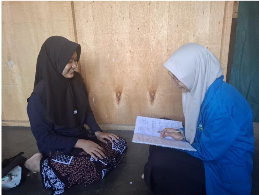
Wawancara peserta putri dan kegiatan bahtsul masail