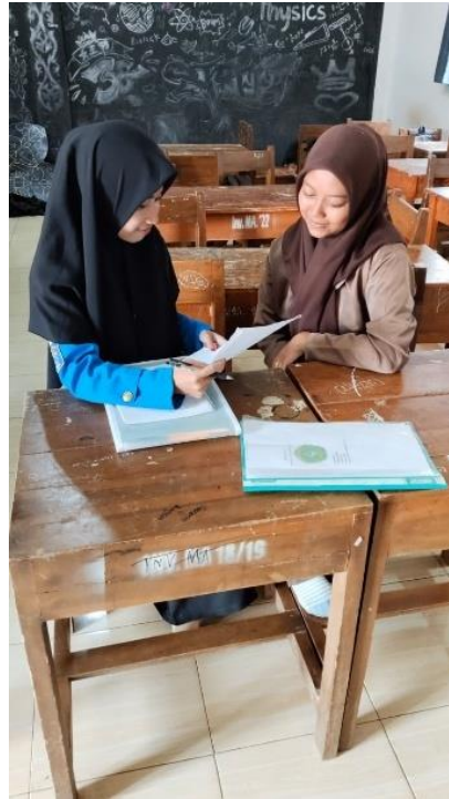
Wawancara dengan siswi kelas XI-1