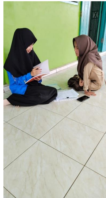
Wawancara dengan siswi kelas XI-5