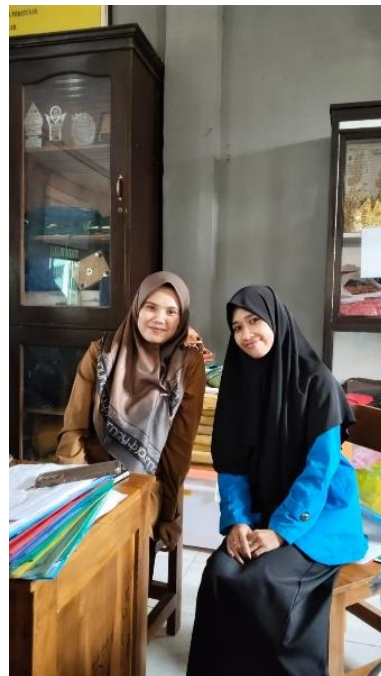
Wawancara dengan Guru Akidah Akhlak MA Ma'arif NU 02 Sidorejo