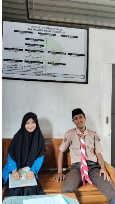
Wawancara dengan Waka Kesiswaan MA Ma'arif NU 02 Sidorejo