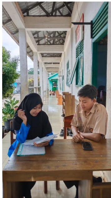
Wawancara dengan siswi kelas XI-3