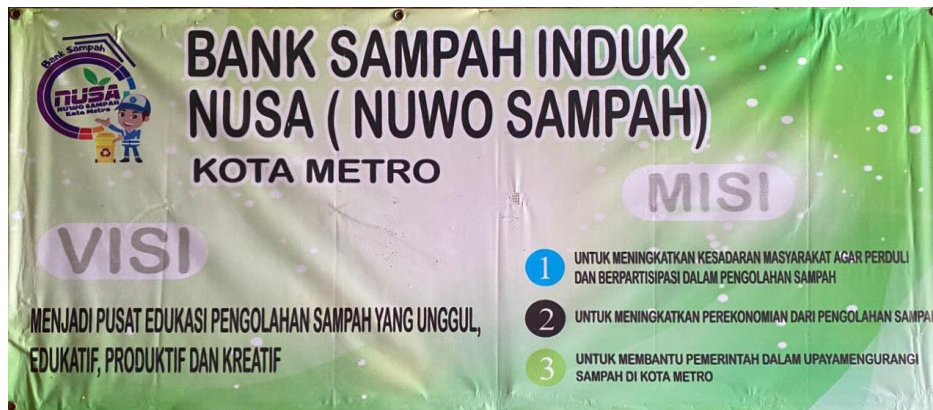
Gambar 4.1 Visi Misi Bank Sampah Induk Nusa 22 Hadimulyo Barat

Berdasarkan visi dan misi tersebut, Bank Sampah Induk Nusa 22 Hadimulyo Barat memiliki tujuan menjadi pusat edukasi pengolahan sampah yang unggul, edukatif, produktif, dan kreatif. Visi ini menunjukkan bahwa kegiatan bank sampah tidak hanya berfokus pada pengurangan sampah, tetapi juga pada peningkatan kesadaran masyarakat serta pengembangan pemanfaatan sampah menjadi produk bernilai guna dan bernilai ekonomi. Adapun misi yang dijalankan meliputi peningkatan partisipasi masyarakat dalam pengelolaan sampah, peningkatan perekonomian melalui pengolahan sampah, serta membantu pemerintah dalam mengurangi jumlah sampah di Kota Metro.