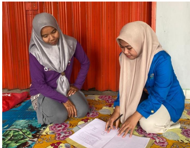
Wawancara dengan masyarakat sekitar Ibu Fili