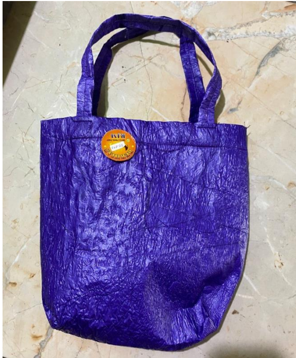
Produk kegiatan Ekonomi Kreatif