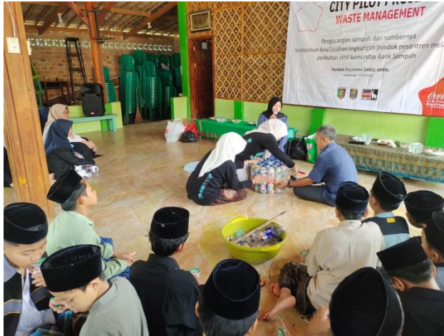
Foto kegiatan pengelolaan limbah sampah di Bank Induk Nusa 22 Hadimulyo Barat