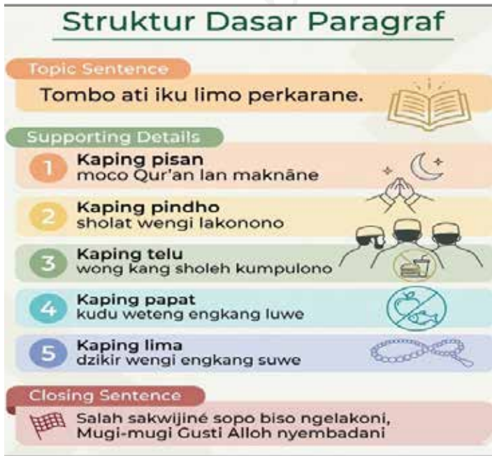
Gambar 2. Struktur Umum Paragraf

Di Indonesia, kerap terdengar lagu ‘Tombo Ati’. Elaborasi tentang paragraf, akan dimulai dengan lagu ini. Pertama-tama, akan disajikan versi aslinya yang ditulis dalam bahasa Jawa. Pembahasan berikutnya akan melibatkan bahasa Indonesia dan bahasa Inggris. Mengapa lagu ‘Tombo Ati’? Karena lagu ini memuat struktur umum sebuah paragraf yang solid. Cermati Gambar 2. berikut untuk menyingkap kerangka T-S-C pada lagu ‘Tombo Ati’.