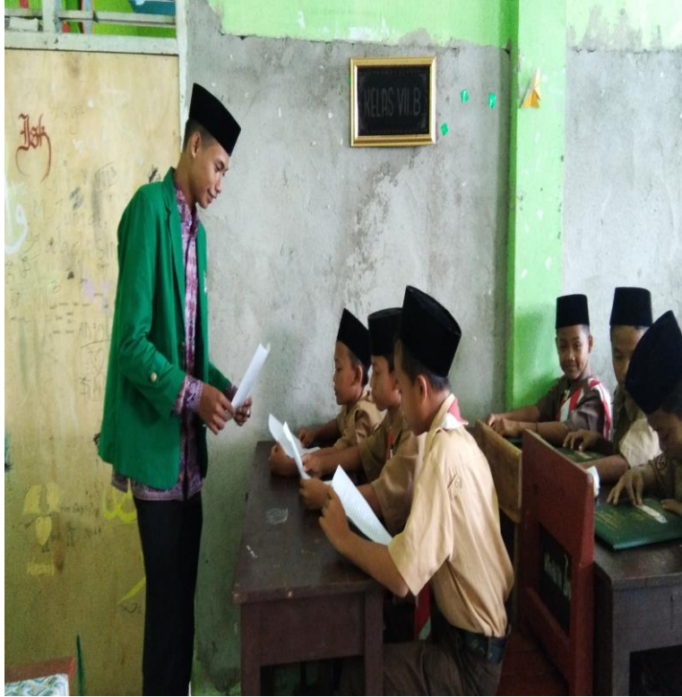
مقابلة مع التلامذ