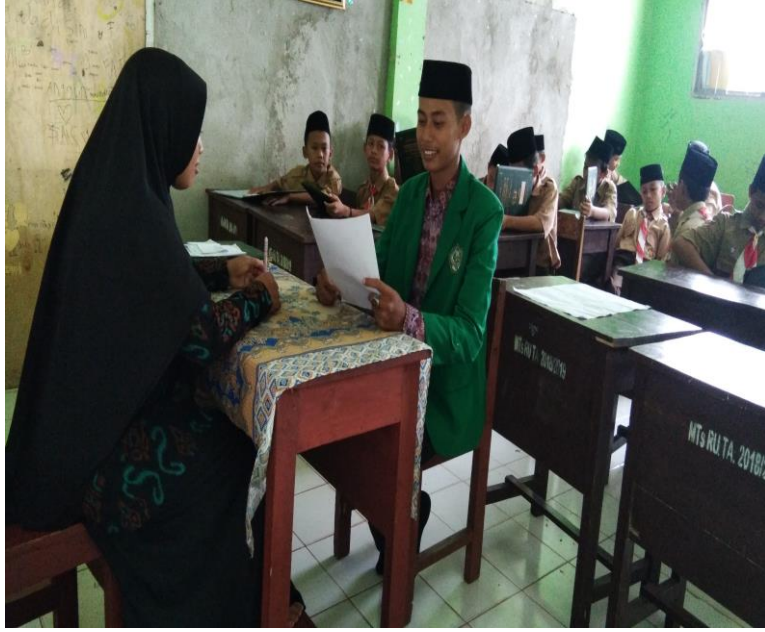
مقابلة مع مدرّسة اللغة العربية