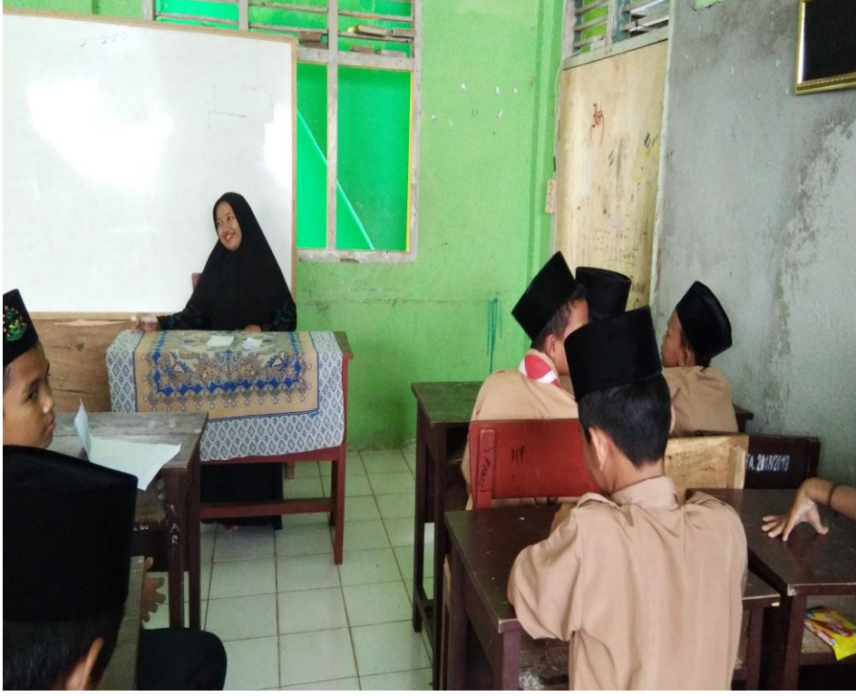
ملاحظة عند التعلم