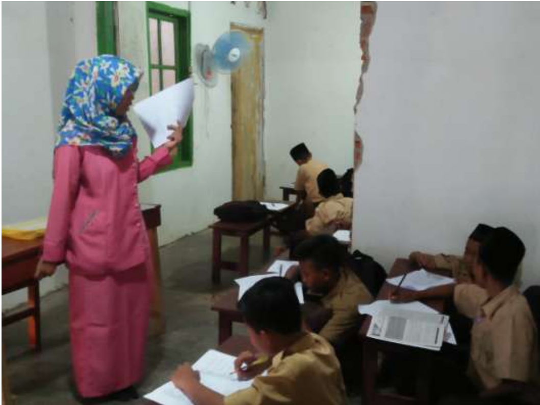
Siswa Mengerjakan Soal Angket Minat Belajar dan Tes Kemampuan Membaca Teks Bahasa Arab