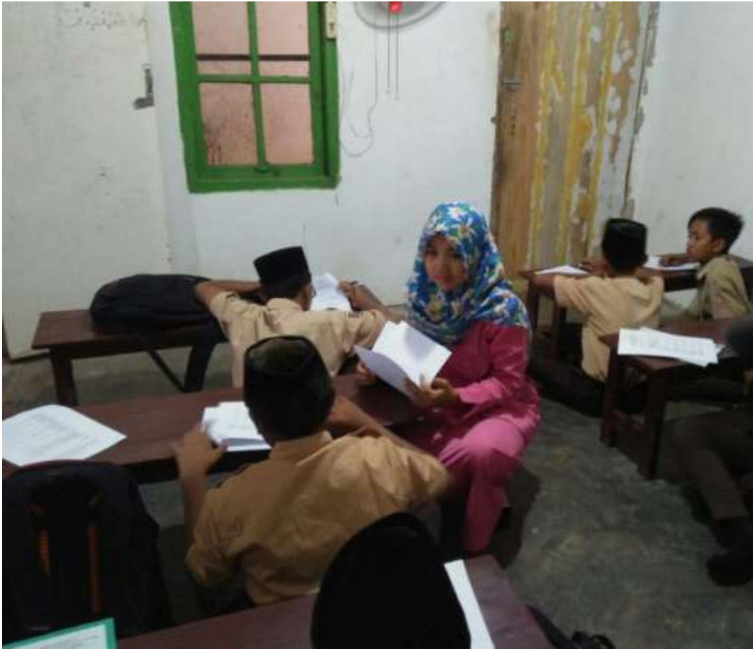
Buku Panduan Belajar Siswa