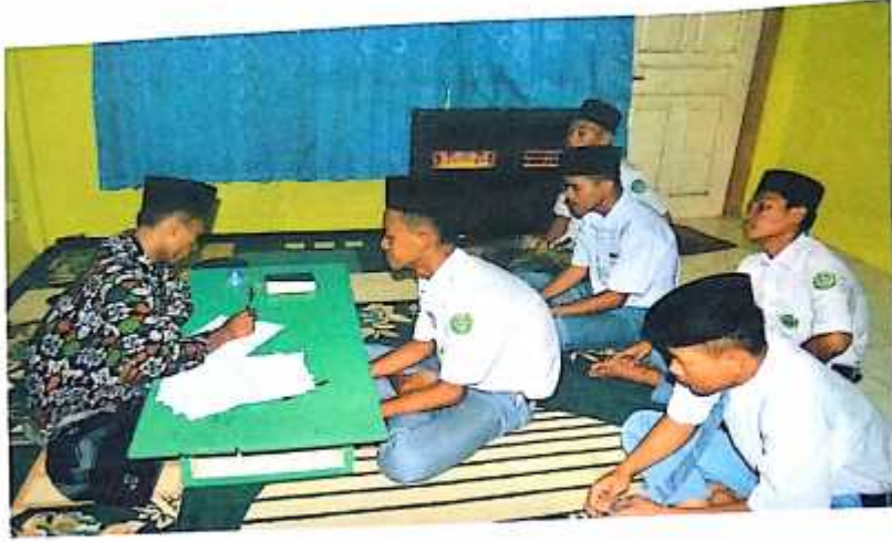
صورة مقابلة الباحث مع التلاميذ الفصل الحدى عشر

بمدرسة دارالأعمال العالية الإسلامية ميتر