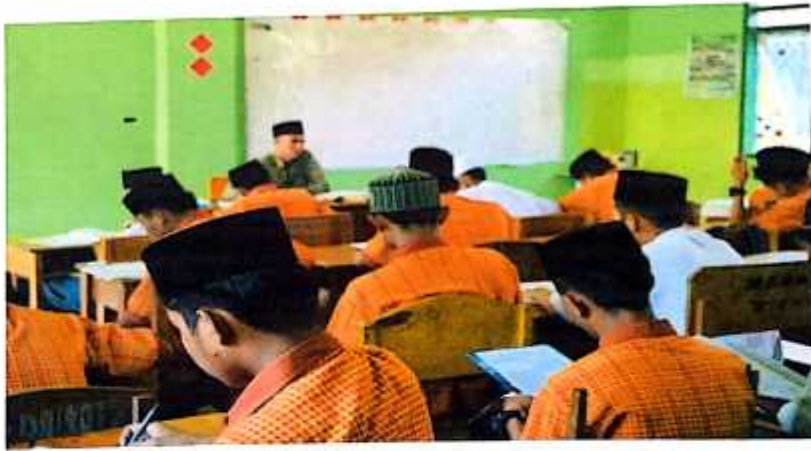
أنشطة التعلم في الفصل الحدى عشر

بمدرسة دارالأعمال العالية الإسلامية ميتر