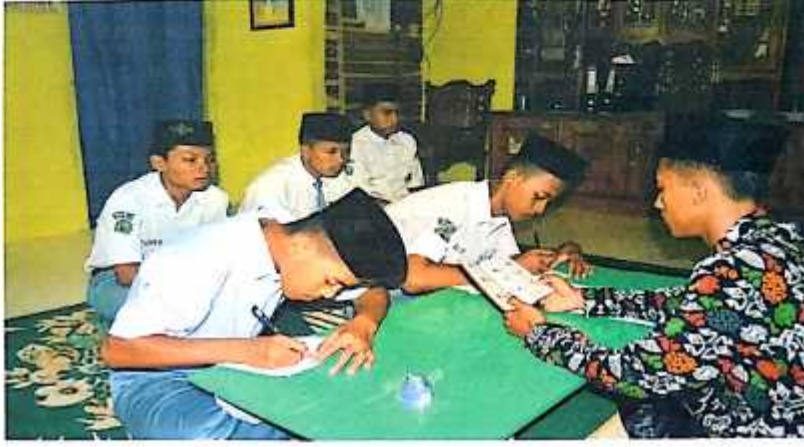
صورة مقابلة الباحث مع التلاميذ الفصل الحدى عشر

بمدرسة دارالأعمال العالية الإسلامية ميترو