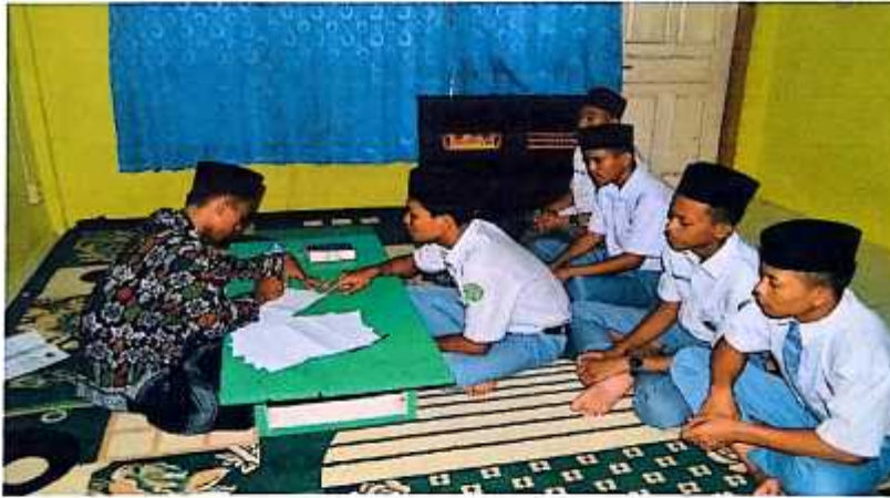
صورة مقابلة الباحث مع التلاميذ الفصل الحدى عشر

بمدرسة دارالأعمال العالية الإسلامية ميترو