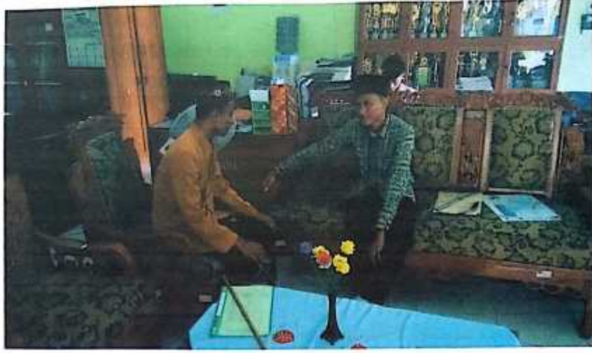
صورة مقابلة الباحث مع المدرس