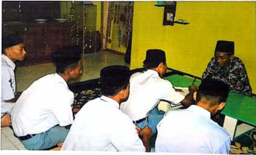
صورة مقابلة الباحث مع التلاميذ الفصل الحدى عشر

بمدرسة دارالأعمال العالية الإسلامية ميتر