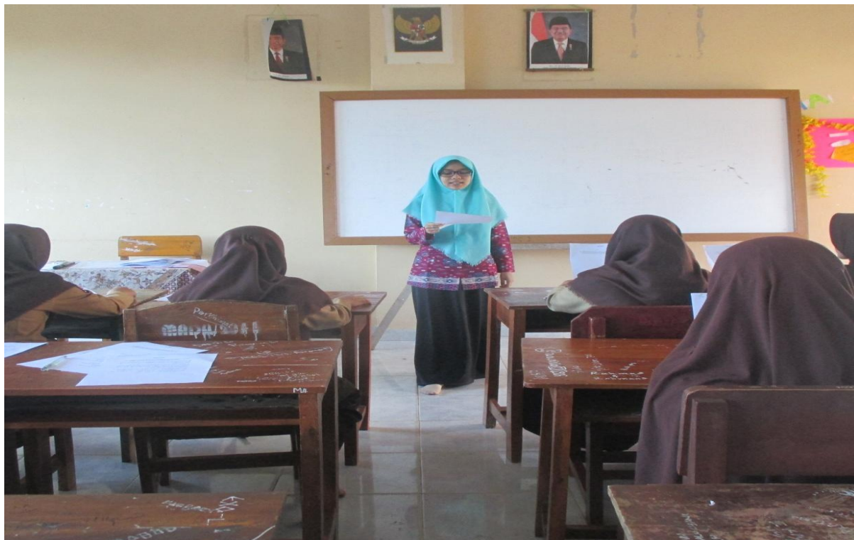
شربت الباحثة المواد