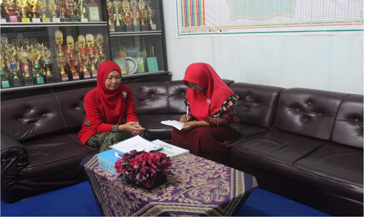
مقابلة مع مدرسة بمدرسة معارف 9 العالية الإسلامية