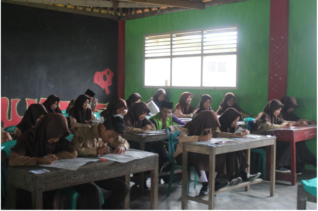
الطلاب يكتبون الإنشاء