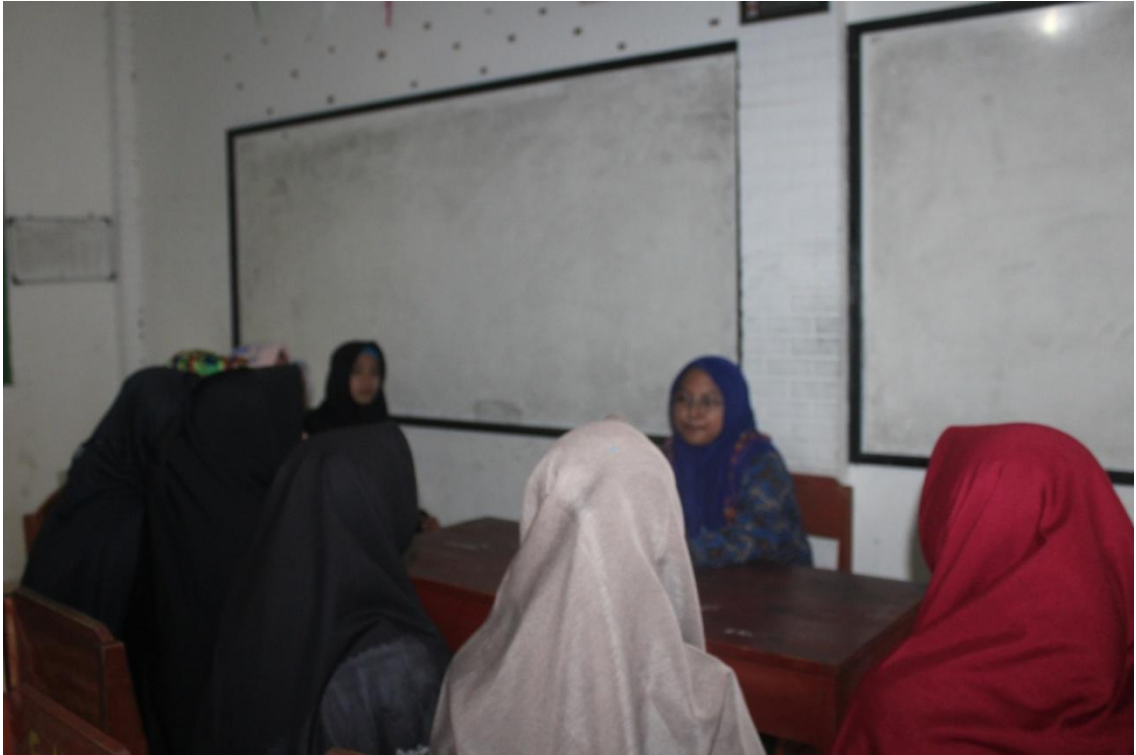
مقابلة مع طلاب بمدرسة معارف 9 العالية الإسلامية