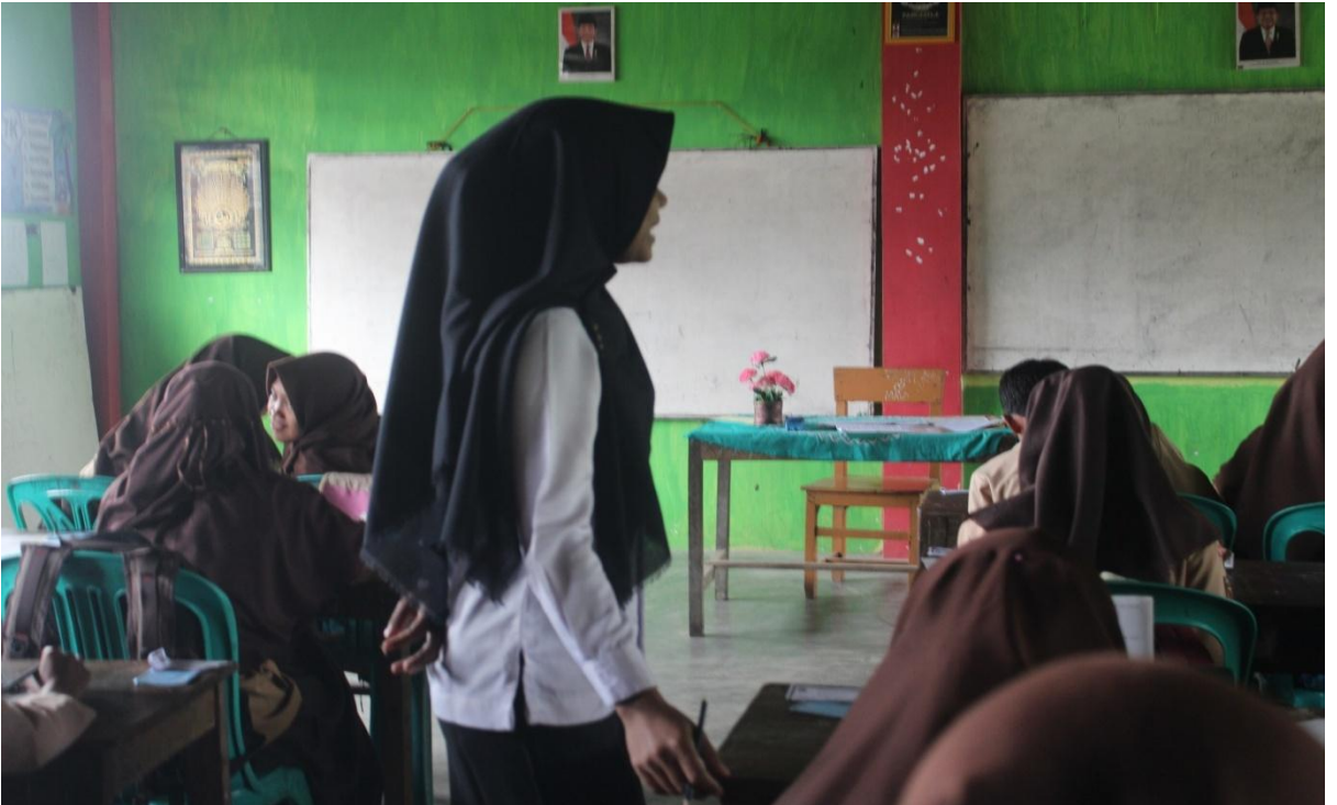
تعلم اللغة العربية في الفصل