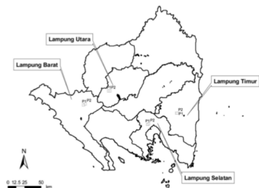
Gambar 1. Lokasi penelitian pada perkebunan lada di empat kabupaten di Provinsi Lampung.

Lokasi penelitian terletak pada empat kabupaten di Provinsi Lampung yang merupakan sentra produksi tanaman lada (Gambar 1). Di setiap kabupaten dipilih dua lahan perkebunan lada di dalam satu desa (Tabel 1) dengan umur tanaman yang sama, yaitu 6 tahun untuk digunakan sebagai plot penelitian meliputi Desa Sekincau (Lampung Barat), Cahaya Negeri (Lampung Utara), Sukadana Baru (Lampung Timur) dan Negara Ratu (Lampung Selatan). Desa Sekincau merupakan daerah dataran tinggi, sedangkan ketiga desa yang lain masuk ke dalam kategori dataran rendah (Tabel 1). Di seluruh lokasi, tanaman lada ditanam dengan menggunakan tanaman hidup sebagai penegak, yaitu gamal ( Gliricidia sepium ) dan dadap ( Erythrina subumbram ).