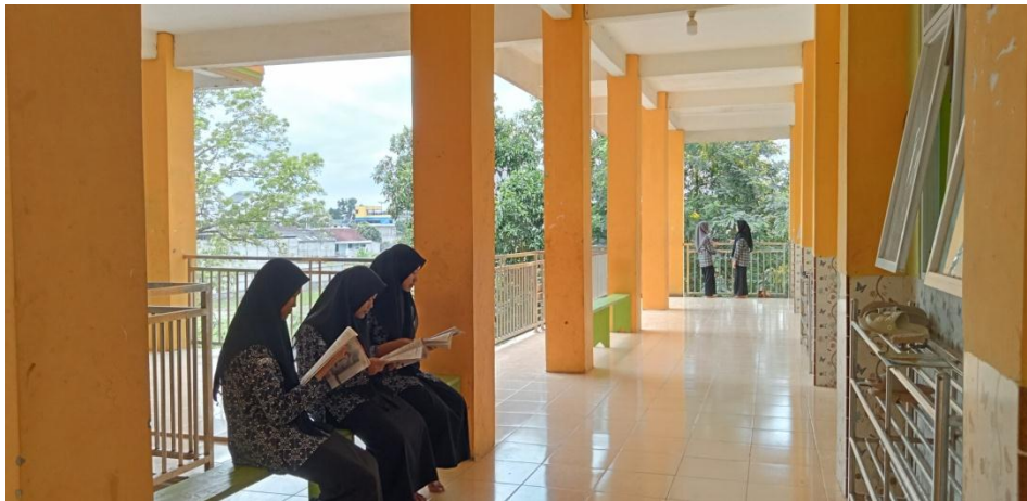
صورة لمبنى المدرسة