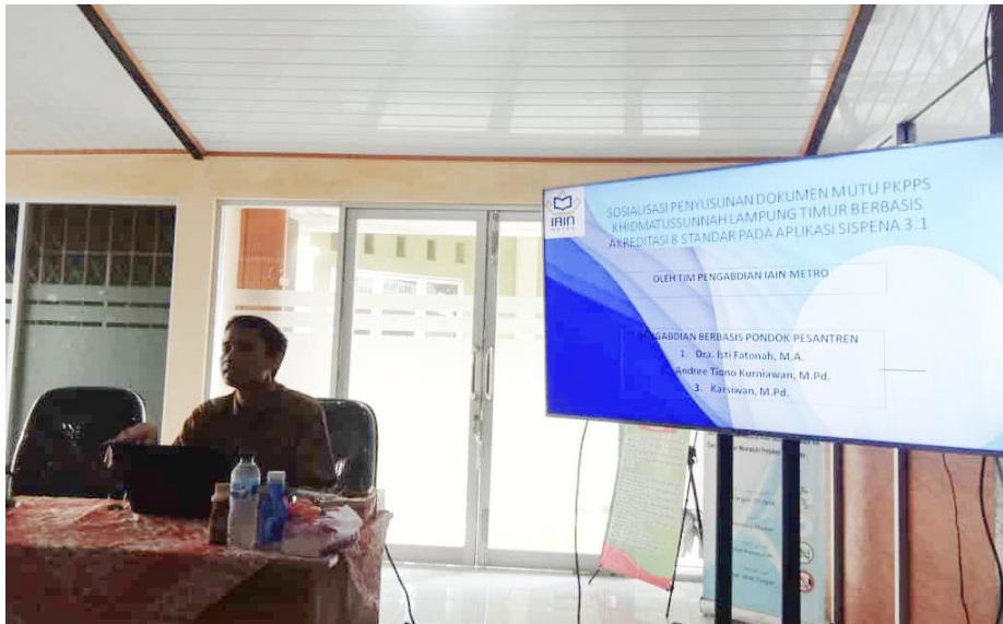
Gambar 1. Kegiatan Sosialisasi Dokumen Akreditasi pada PKPPS Khidmatusunnah