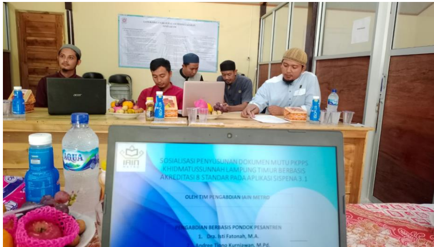
Gambar 2. Kegiatan Pendampingan Penyusunan Dokumen Akreditasi pada PKPPS Khidmatusunah

keberadaan dokumen/daftar kepemilikan peralatan pembelajaran, bahan bacaan, dan media pembelajaran yang dimiliki satuan pendidikan.