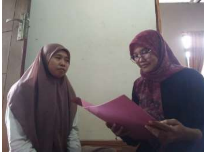
Wawancara dengan Ibu Kapila