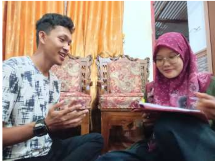
Wawancara dengan Bapak Catur