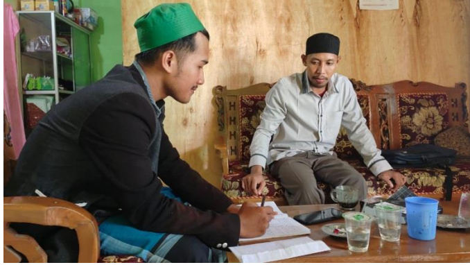
تصوير المقابلات مع مدرس