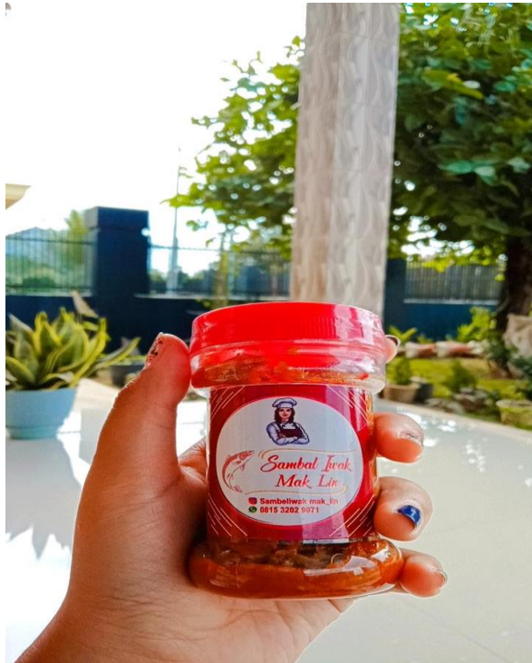
Gambar 4.1 Produk sambel Iwak Mak Lin

yang sudah tertera didalam keterangan pada produk sambel yang di upload pemilik usaha sambel di akun media sosial. 1 Seperti pada gambar berikut: