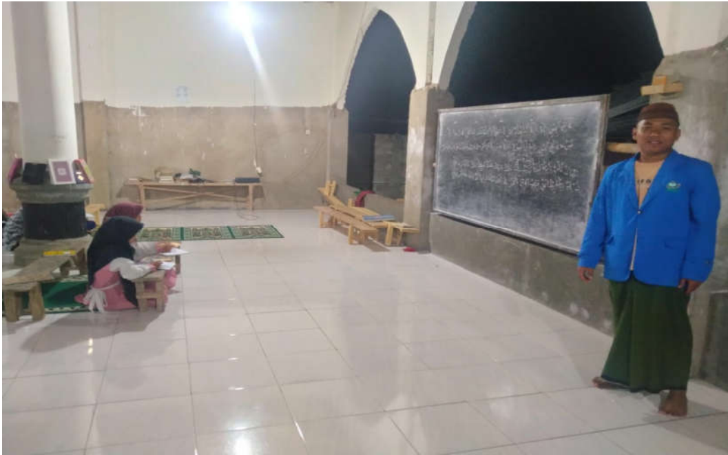
Foto Proses Pembelajaran Kitab Kuning