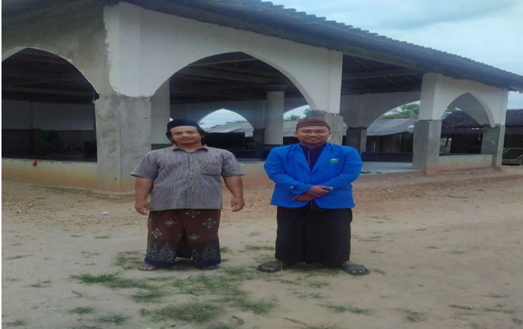
Foto Bersama dengan Bagian Kurikulum Pondok Darul Falah