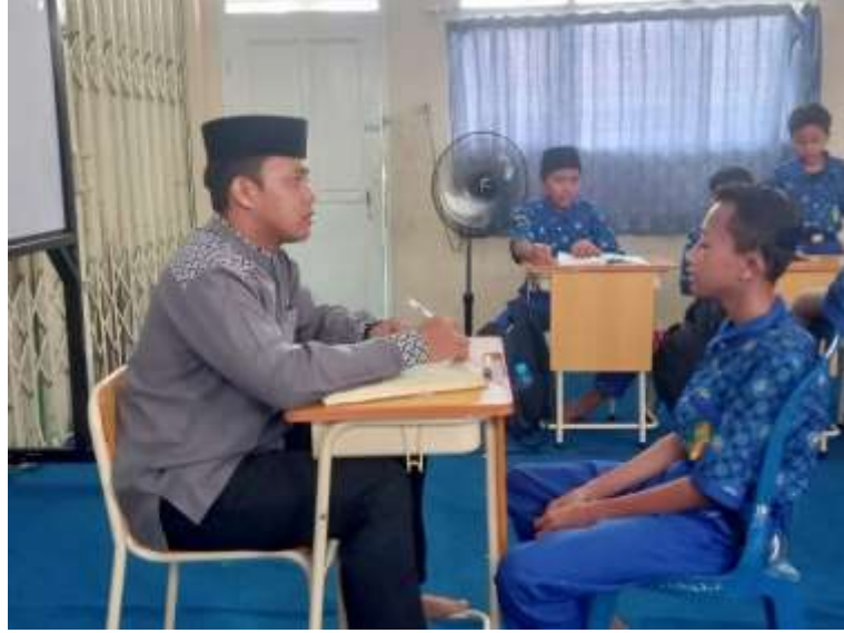
(المدرس يقدم تحفيز لتعلم اللغة العربية)